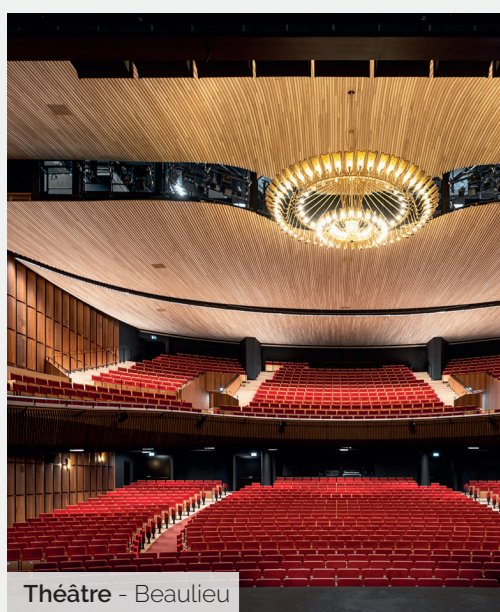
Théâtre - Beaulieu

ALVAZZI DIVISION MULTISERVICES, UN SEUL INTERLOCUTEUR POUR VOS LOTS TECHNIQUES ET DE CONCIERGERIES