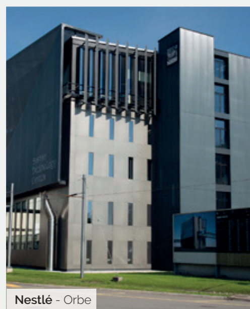
Nestlé - Orbe